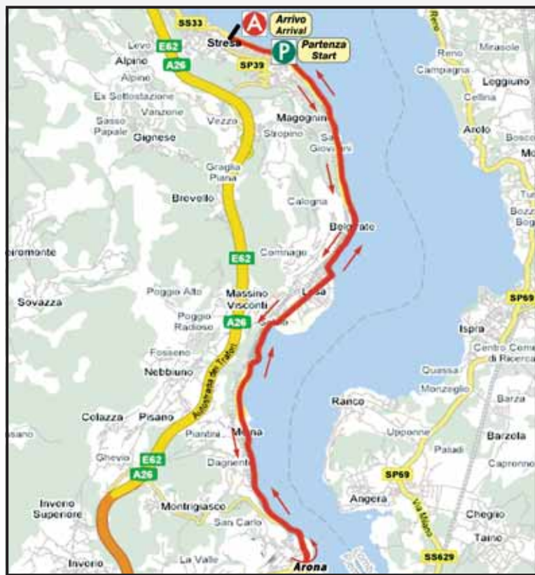
PLANIMETRIA E ALTIMETRIA GENERALE